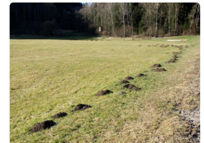
Linear angeordnete Maulwurfshügel.