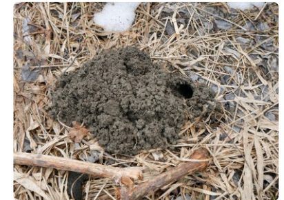
Scherhaufen mit seitlich gelegener Öffnung.