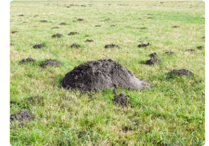
Maulwurfshügel und große Maulwurfsburg.