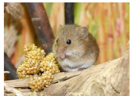
L: Nest der Zwergmaus. M: Typischer Lebensraum der Zwergmaus. R: Zwergmaus.